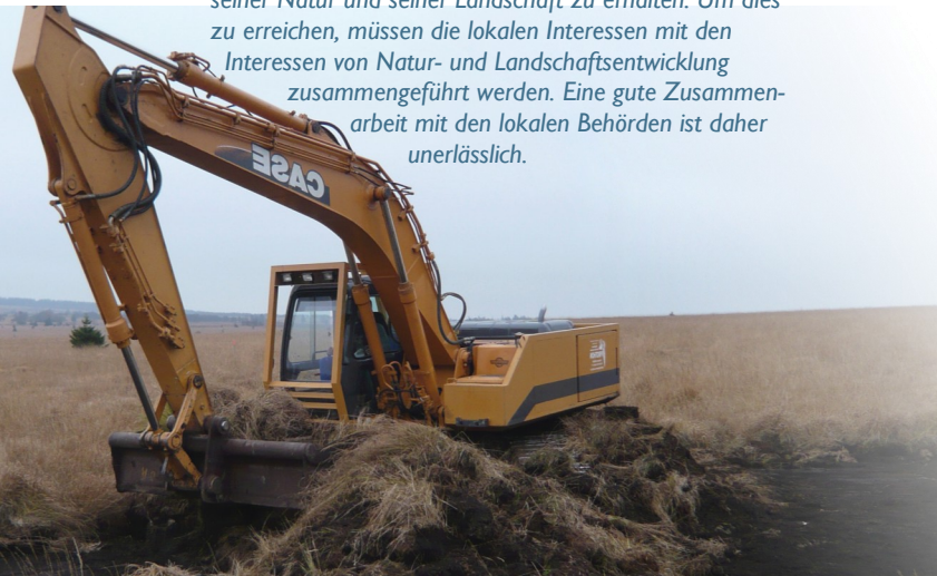
Travaux de restauration des Hautes Fagnes Renaturierungsarbeiten im Hohen Venn

Ein Naturpark ist also nicht zu verwechseln mit einem Naturschutzgebiet. Er zielt darauf ab, Naturschutz und menschliche Tätigkeiten miteinander zu verbinden. Ein Naturschutzgebiet verfolgt hingegen das Ziel, einen seltenen oder bedrohten natürlichen Lebensraum von großem biologischem Interesse zu schützen. Naturparks sind auch größer. Sie können eines oder mehrere Naturschutzgebiete beinhalten. Ein Beispiel ist das staatliche Naturschutzgebiet des Hohen Venns.