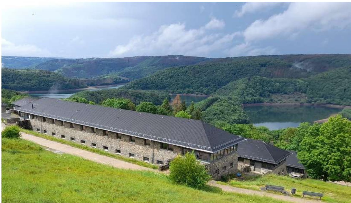
Das Naturschutz-Bildungshaus ‚Eifel-Ardennen-Region‘, mit Blick von Südosten über die Urfttalsperre